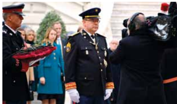
S.A.S. le Prince Souverain a ensuite remis des distinctions honorifiques, en présence des Membres de Sa Famille, aux personnels de la Force Publique et du Palais Princier. L'intégralité des cérémonies a été retransmise sur Monaco Info, les comptes Facebook de Monaco Info et du Gouvernement Princier, ainsi que sur Monaco Channel.