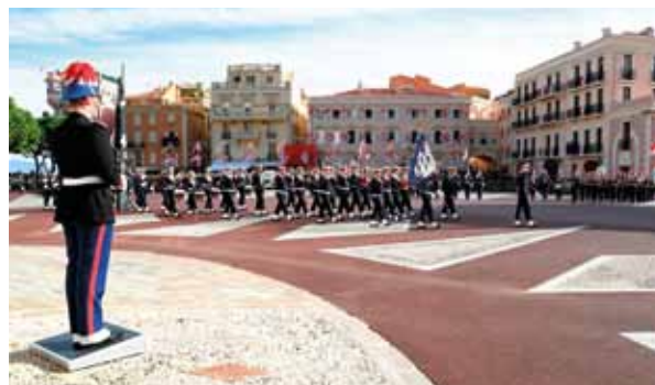
... puis a eu lieu le traditionnel défilé militaire, en présence, cette année, du bagad de Lann-Bihoué et d'un peloton de la Marine Nationale française.