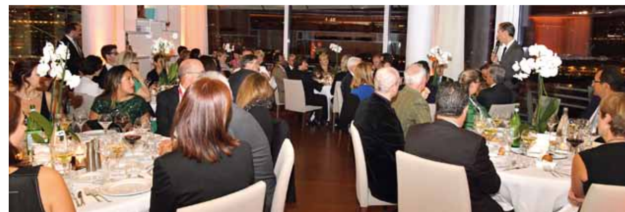
Le soir du 11 octobre, les délégations ont été conviées à un dîner officiel au Yacht Club.