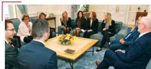
La Promotion 2016/2017 de la FSA a été reçue à la Résidence du Ministre d'Etat le 13 octobre.

« Grâce à mon Master 'Sciences Humaines et Sociales', mention 'Tourisme', j'avais déjà effectué plusieurs missions au sein de la Direction du Tourisme et des Congrès (DTC). J'ai alors souhaité intégrer la FSA afin de parfaire mon parcours, mais aussi découvrir d'autres Services de l'Administration. Désormais, je désire rejoindre la DTC. Toutefois, je suis également intéressé par toute mission qui vise à promouvoir la Principauté, ainsi que par le Département de l'Equipe-ment, de l'Environnement et de l'Urbanisme. »