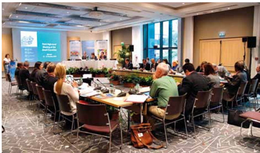
La 3 e Réunion de Haut niveau de l'Initiative des petits pays de l'OMS a notamment permis l'adoption de la Déclaration de Monaco.

La Principauté a accueilli les 11 et 12 octobre la 3 e Réunion de Haut niveau de l'Initiative des petits pays de l'OMS (Organisation Mondiale de la Santé) Europe. Cette réunion de haut niveau a été l'occasion d'accueillir les Ministres de la Santé des petits pays afin d'engager une réflexion commune sur les moyens requis pour mettre en œuvre les objectifs de développement durable (ODD) liés à la santé, dans le cadre du Programme de développement durable à l'horizon 2030. Gros plan sur les acquis et l'organisation de ces journées d'échanges.