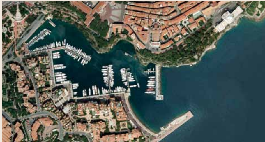
Voici une partie de l'ortho-photographie de Monaco concernant le port de Fontvieille et ses alentours.

L'ortho-photographie de Monaco s'appuyait sur des vues aériennes réalisées en 2009. Or le visage de la Principauté évolue rapidement. Constituant une base de données à part entière et permettant de nombreuses applications, elle a donc été actualisée. Un travail conséquent effectué par la Direction de la Prospective, de l'Urbanisme et de la Mobilité (DPUM).