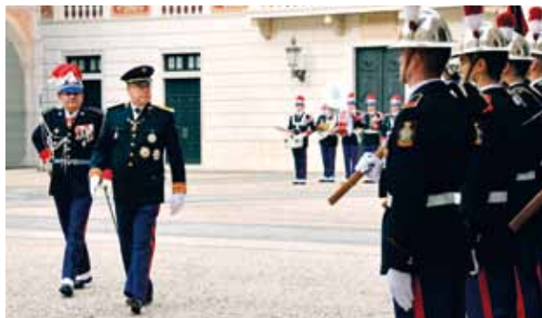
Cette journée de cérémonies et de festivités a débuté avec la prise d'armes regroupant la Force Publique (Compagnie des Carabiniers du Prince et Corps des Sapeurs-pompiers) dans la cour d'Honneur du Palais Princier. Pour l'occasion, S.A.S. le Prince Souverain est en grande tenue.

Rassemblement des Monégasques et habitants de la Principauté autour de la Famille Princière, la Fête Nationale, rendez-vous annuel incontournable du 19 novembre depuis 1952, est l'occasion pour la communauté nationale de célébrer son identité et ses traditions. Reportage en images.