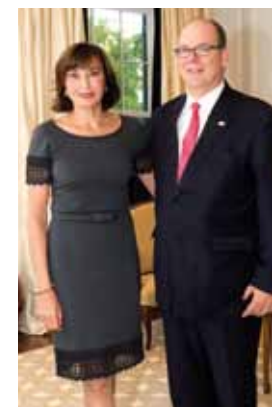
S.E. Mme Maguy MACCARIO-DOYLE aux côtés de S.A.S. le Prince Souverain.

Le Président américain Barack OBAMA a quant à lui adressé un message de félicitations, rappelant que la Principauté et les Etats-Unis entretiennent des liens étroits depuis plus de 150 ans.