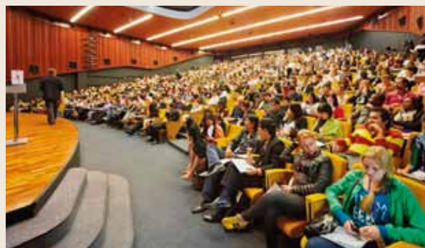
Les étudiants monégasques peuvent désormais solliciter une aide facilitant l'accès au prêt.

Complémentaire de la bourse d'études, cette aide octroyée sans condition de ressources est réservée aux Monégasques âgés au plus de 30 ans sou-