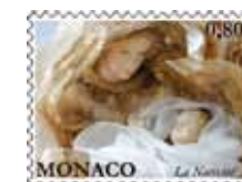
Impression : Offset Format du timbre : 40,85 x 30 mm horizontal Tirage : 70.000 timbres-poste Feuille de 10 timbres-poste avec enluminures Tarif : 0,80 €

A l'occasion du Chemin des Crèches installé à Monaco-Ville de décembre 2015 à janvier 2016, le public a eu l'occasion de découvrir une cinquantaine de crèches venant des 4 coins du monde. Le visuel du timbre représente la Nativité de Venise.