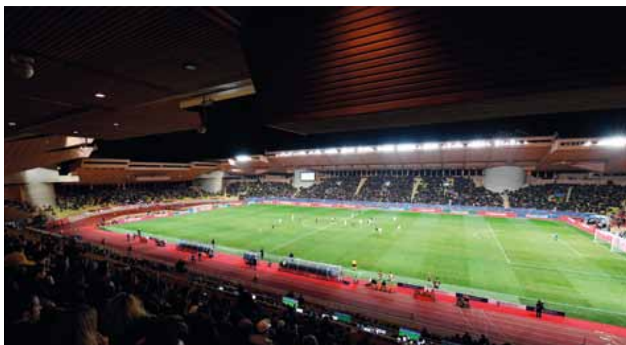
De telles mesures ont notamment été mises en œuvre au Stade Louis II lors du match de Champion's League opposant, le 22 novembre, l'AS Monaco FC au Tottenham Hotspur FC.

Les règlements des différents championnats de la Ligue Professionnel de Football et de l'U.E.F.A. imposent notamment aux Clubs visités de mettre en place un dispositif d'accueil, de contrôle et de sécurité adapté. Dans ce cadre, le Département de l'Intérieur, en partenariat avec l'AS Monaco FC et l'ensemble des différents Services sollicités dans l'organisation, définit et met en œuvre les mesures de sécurité nécessaires tant à l'intérieur qu'aux abords du Stade Louis II afin que chaque match puisse se dérouler dans un contexte de fête et un esprit respectueux, tolérant, sportif et de fair-play.