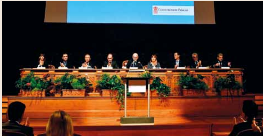
Le CSA a tenu sa réunion plénière annuelle le 21 octobre au Musée Océanographique.

Né de la volonté de S.A.S. le Prince Souverain, le Conseil Stratégique pour l'Attractivité (CSA) a pour mission de proposer des outils d'analyse et de prospective afin de contribuer aux réflexions concernant le développement économique de la Principauté, l'augmentation des recettes de l'Etat, la maîtrise des dépenses publiques et les orientations stratégiques. Une instance devenue indispensable aux grands projets du Gouvernement Princier.