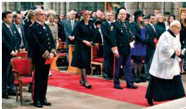
Autre moment fort de la Fête Nationale : la célébration de la Messe d'action de grâce et du Te Deum en la Cathédrale de Monaco, qui témoigne l'attachement de la Principauté à la foi catholique. Ici, le Couple Princier fait son entrée sous le regard des personnalités monégasques.